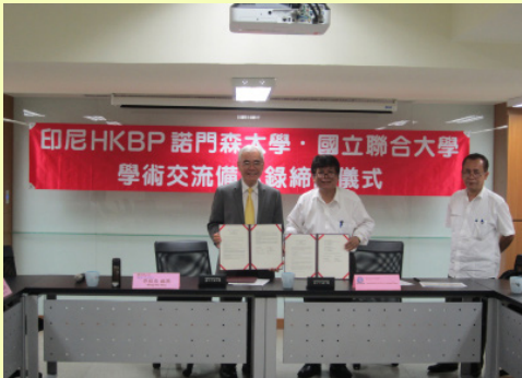
本校與印尼諾門森大學簽約締結為姊妹校

印尼HKBP諾門森大學成立於1954年，建有兩個校區，分別位於北蘇門答臘省棉蘭市與先達市，教職員工人數近 300 名，學生人數近 1萬2千名，大學部科系包含醫學、法律、經濟、社會政治、教育、工程、畜牧、農業、語言人文及心理等，2003年成立學士後研究，目前有管理與教育均為英語學程。正式成為姊妹學校後，雙方皆期待各項交流能蓬勃發展。