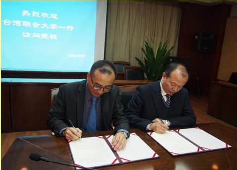
本校與大陸成都信息工程大學簽約締結姊妹校

大陸成都信息工程大學成立於1951年，建有兩個校區，分別位於成都市航空港校區及龍泉校區，現有專任教師人數近 1200 名，學生人數近 1萬9千名，是中國西南地區普通高校中唯一的一所獨立設置的信息工程類院校，學科覆蓋理學、工學、管理學、文學、經濟學。成都信息工程大學曾是中央氣象局直屬的獨立設置的三所氣象院校之一。大氣科學一直是學院的優勢專業和獨特專業，也是四川省唯一的氣象類專業。1978年4月擴建為4年制理工科本科高等院校。正式成為姊妹學校後，雙方皆期待各項交流能蓬勃發展。