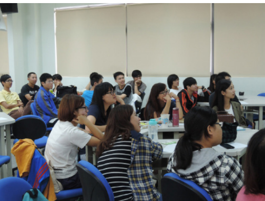
社工師互動式教學，同學於台下認真聽講

為了結合視覺傳播與影像的專業力量，此次工作坊特別在結束後辦理影音競賽，由學生們發表自己對兩性或性別議題的觀察和想法，呈現學習心得與成效。作品應以兩性互動或性別議題為主題，不拘形式、手法，主辦單位也將提供優渥禮券給優秀團隊，報名及收件時間：104年12月15日至104年12月31日。