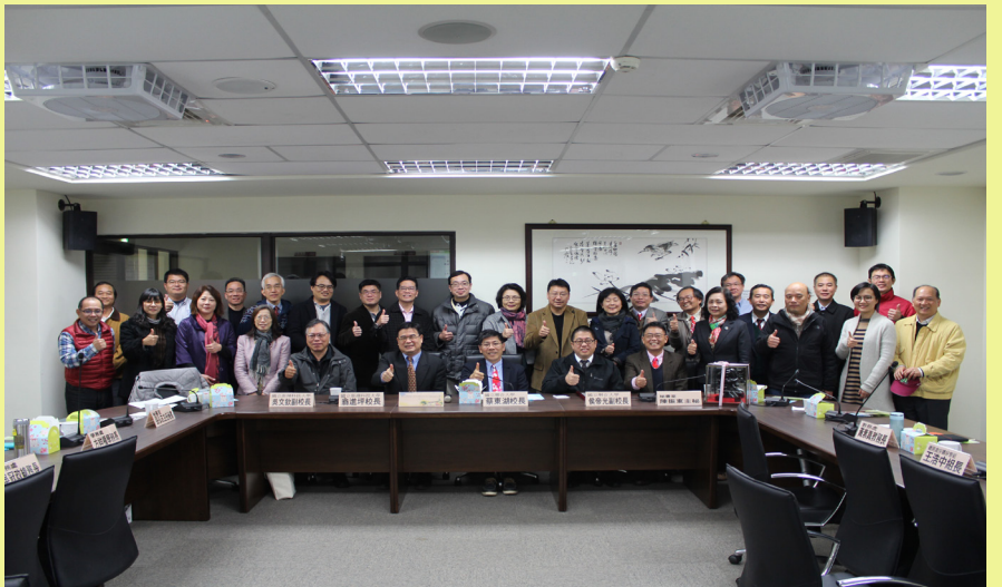
澎科大校長暨行政主管等貴賓蒞臨聯合大學進行交流座談並留下合影。