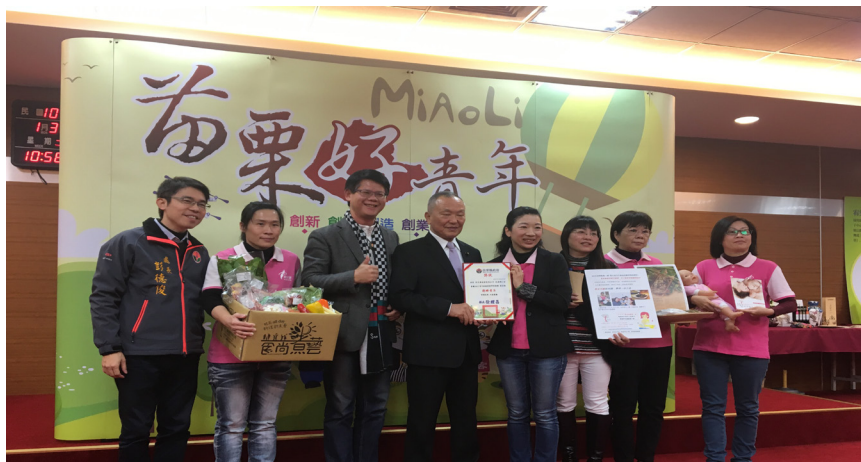
聯大育成中心成功輔導出多位優秀創業者。