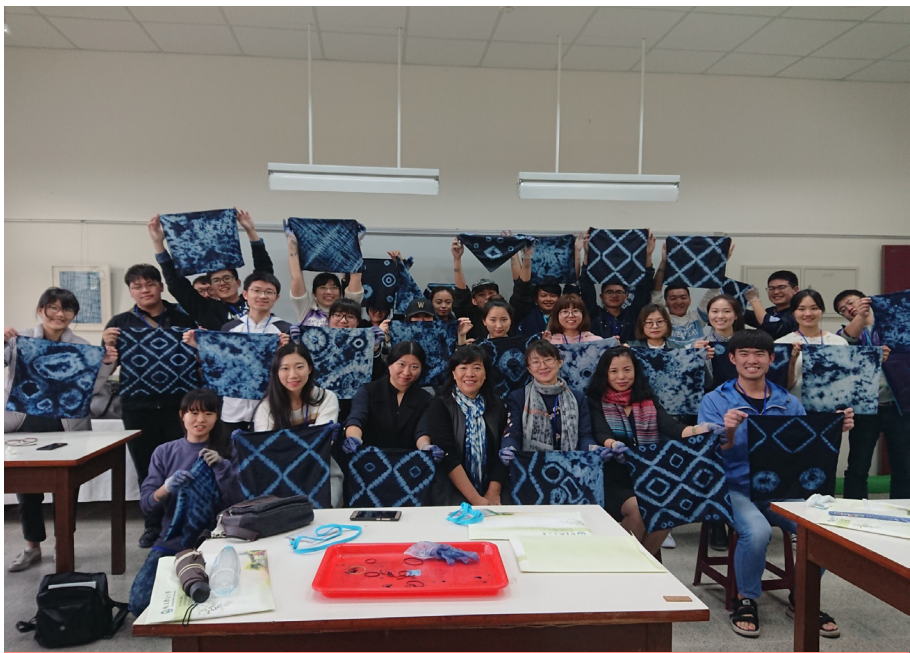
哈爾濱工業大學蒞臨聯合大學進行短期交流

本校大陸地區姊妹校哈爾濱工業大學(以下簡稱哈工大)，於107年1月21日至27日共有5位外賓及19位學生蒞校進行短期交流活動。