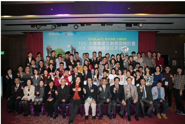
全體人員大合照。