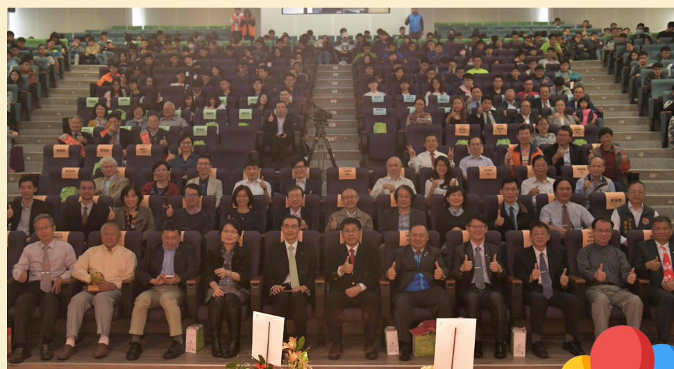
聯大47周年校慶與會嘉賓合影

聯大47週年校慶，很高興和大家分享師生努力的成果，也恭喜今年度的傑出校友，在競爭激烈的選拔中脫穎而出。同時感謝各界人士捐款嘉惠聯大學子，挹助聯大發展。再次謝謝大家的蒞臨與指導，祝福大家闔家安康、萬事如意。