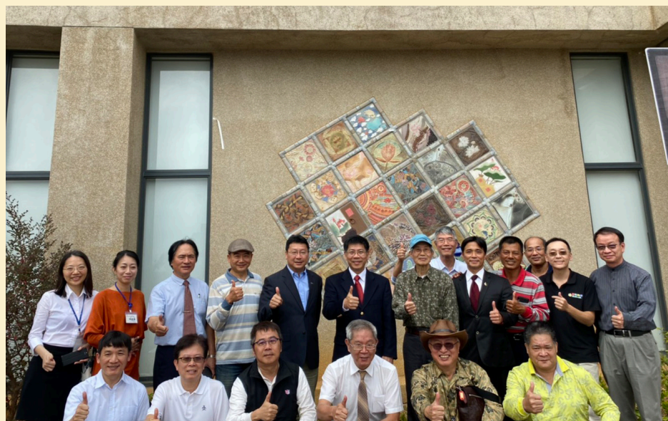
全體與會人員合影

國立聯合大學創校四十七周年以來，為我國人才培育貢獻非凡心力，造就無數社會傑出菁英人才。其中，該校材料科學工程系前身「陶瓷玻璃科」、「陶業工程科」更為我國造就許多陶瓷工業與藝術人才，其中多位校友早已是享譽海內外的陶藝家，為臺灣陶藝貢獻非凡成就。於此機緣下，在該校早期授課教師陳煥堂陶藝家的召集下，以「聯合陶友 飲水思源」為創作主題，邀集聯合陶友們創作二十七片藝術陶板，鑄成陶壁，設置於國立聯合大學藝術中心牆面。每片陶板均以「蓮」、「荷」為創作題材，契合「聯合」校名，並寓飲水思源、感恩母校之意。