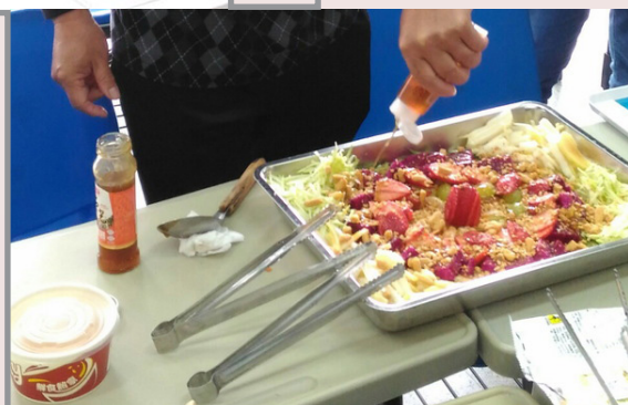
受獎生製作馬來西亞年菜「撈魚生」