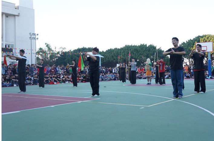
◀ 國術社為校慶帶來的開場表演。