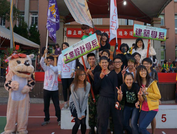
◀ 創意進場精彩表演，得獎系所為工設系、建築系，歡喜合照。